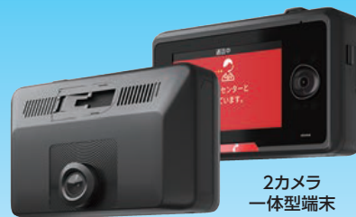
2カメラ 一体型端末