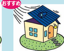
風災、雹(ひょう)災 雪災*1