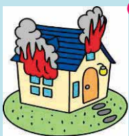
火災、落雷 破裂・爆発