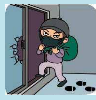
盗難・騒擾(そうじょう)