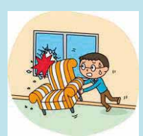
左記以外の偶発的な破損 事故等